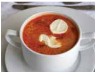
Supă de fasole Jókai Jókai bableves