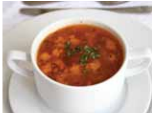
Ciorbă țărănească de vită Növendék parasztsorba