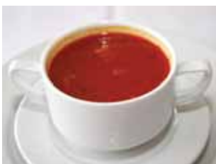
Ciorbă pescărească de la Sânpaul Szentpáli halászlé