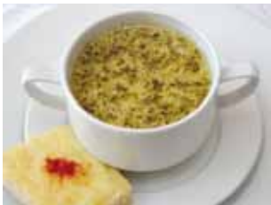
Supă franțuzească de ceapă cu toast cu cașcaval Francia hagymaleves sajtos tósztal