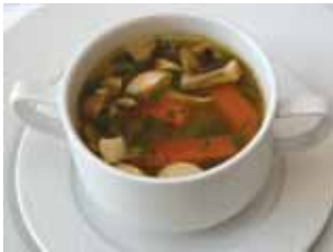
Supă de pui „Újházi” Újházi tyúkhúsleves