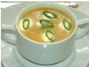
Ciorbă de burtă Pacalcsorba